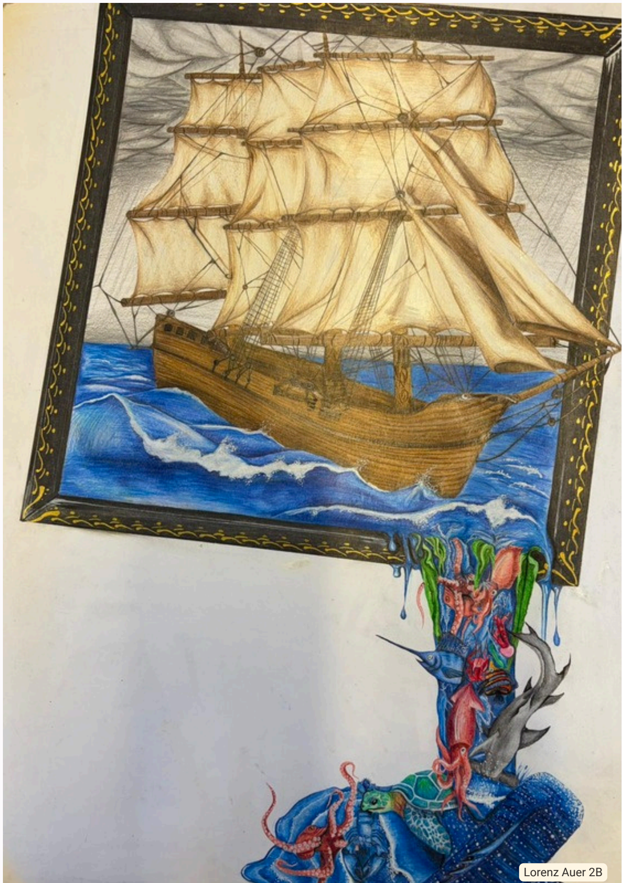
Lorenz Auer 2B