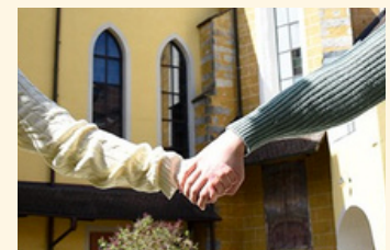
ein Bild vom Fotoworkshop zu unserem Jahresthema

Hand in Hand bedeutet enge Verbundenheit, gegenseitige Unterstützung und gemeinsamer Weg. Zwei Menschen greifen wörtlich oder symbolisch ineinander, um sich Halt zu geben, Herausforderungen zu meistern und Freude zu teilen. Es symbolisiert Vertrauen, Gleichberechtigung und tiefe Verbundenheit.